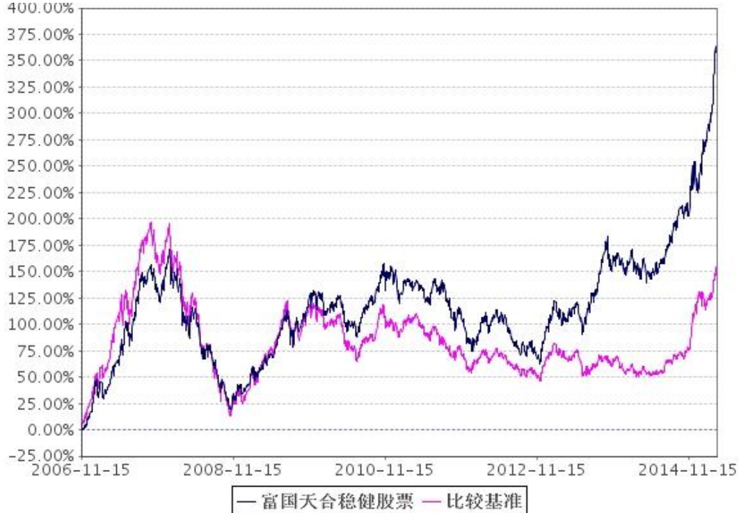
2、自基金合同生效以来富国天合稳健优选股票型证券投资基金累计份额净值增长率与业绩比较基准收益率的历史走势对比图